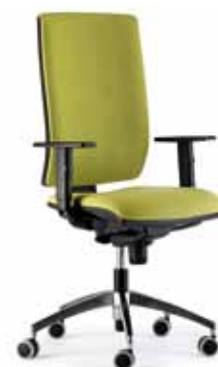
Disponible versión tapizada