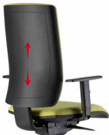
Respaldo regulable, versión Tapizada