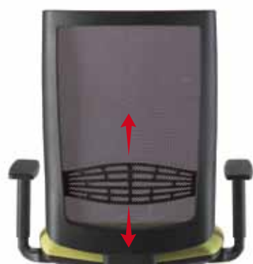
Regulación lumbar, versión Malla