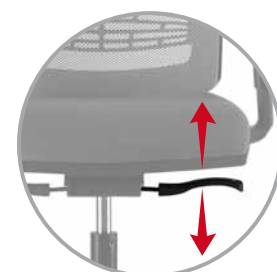
Basculación respaldo Syncro